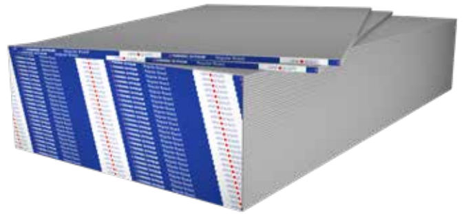
Hình tấm Yoshino tiêu chuẩn 9.5mm